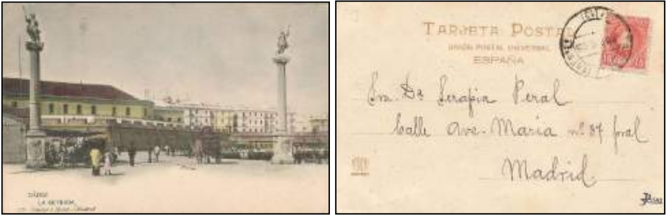
Reverso 16, de 1904, logo de los editores y texto en marrón.