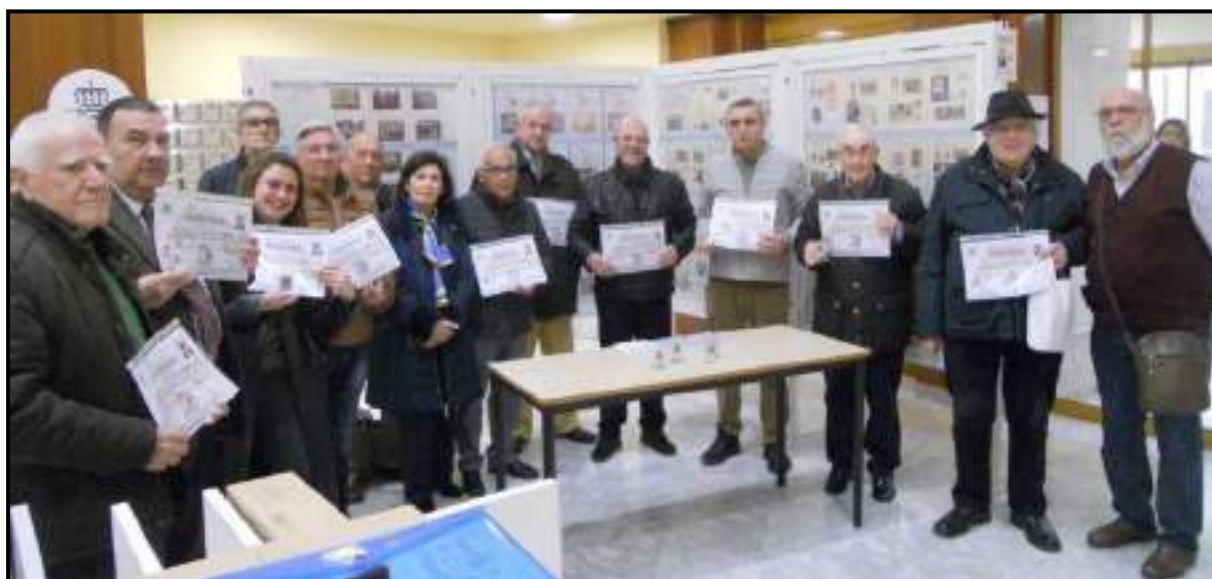
Asistentes a la clausura de la exposición el 5 de marzo