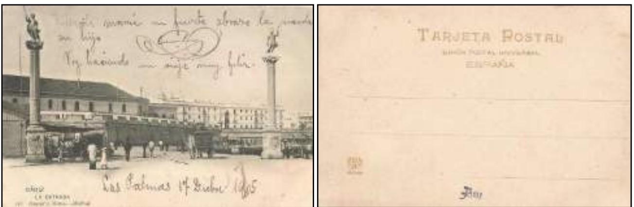
Reverso 16, de 1904, logo de los editores y texto en marrón. La diferencia con la anterior radica en que está coloreada.