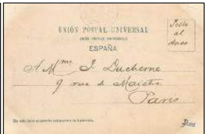
La tercera edición de la nº 116 “La entrada”, se reconoce por ‘carro con tonel’, tiene cuatro ediciones, las de reverso de 9 (1900) y 15 (1904) los refleja el catálogo de Martín Carrasco de 1992, y dos que presento de mi colección que no están recogidas en el catálogo (página siguiente).